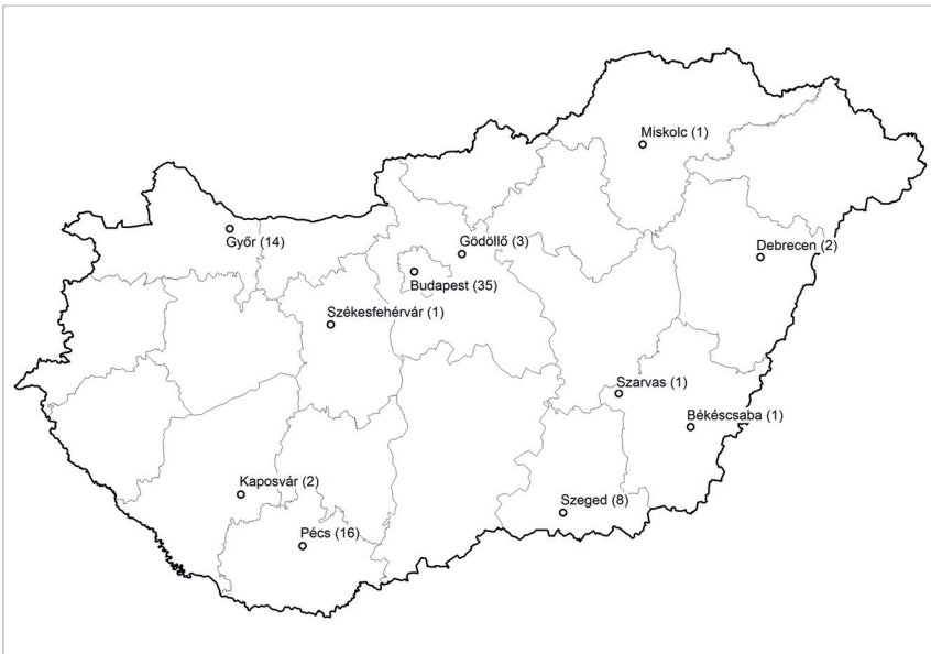
1. ábra: A Tér és Társadalom szerzőinek (munkahely szerinti) területi megoszlása, 2014 Spatial distribution of Space and Society's authors (according to workplace), 2014

A korábbi évekhez képest jelentősebb átrendeződést lehetett megfigyelni 2014-ben a szerzők tudományterületi besorolása tekintetében. Tavaly szerzőink 40 százalékát (34 fő) sorolhattuk a regionális tudományt képviselők közé. Intézményi, akadémiai köztestületi hovatartozása alapján 18 szerzőnk közgazdaságtudományi kötődésű volt, míg tízen érkeztek a társadalomföldrajz szakterületéről. Az utóbbi évekhez képest nemcsak a regionalista kutatók arányának erősödését és a közgazdaságtudomány és a társadalomföldrajz szerzői arányai-