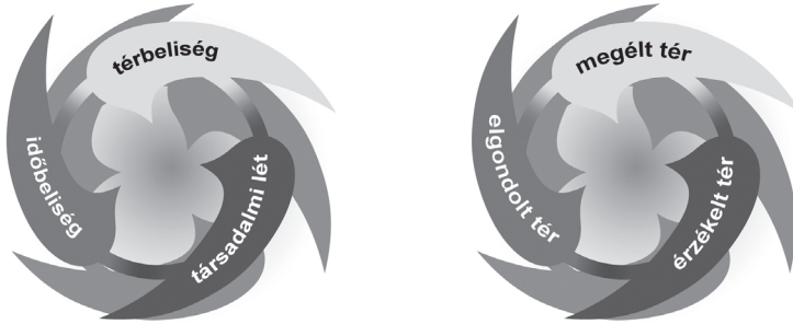
1. ábra: A „létezés trialektikája” és a „térbeliség trialektikája” The 'trialectics of being' and the 'trialectics of spatiality'